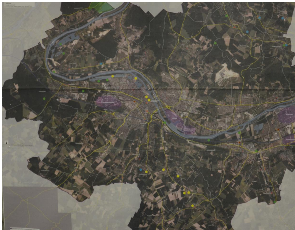
Contribution cartographique des participants sur la thématique paysage : les gommettes jaunes représentent les espaces publics remarquables à préserver et à valoriser, les gommettes vertes, les éléments de paysage remarquables