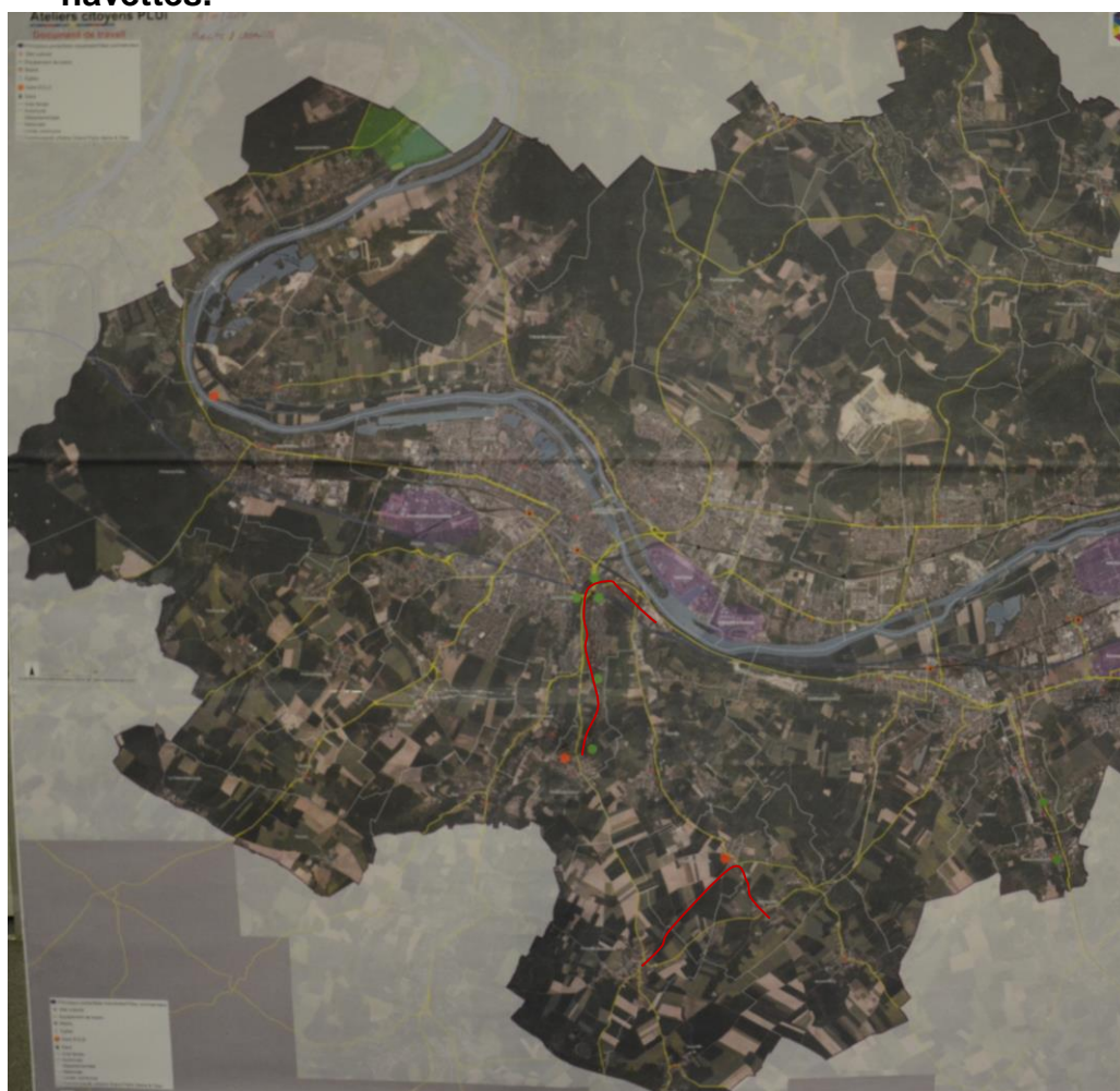
Contribution cartographique des participants sur la thématique mobilité & urbanité : les tracés rouges indiquent les itinéraires doux que les participants aimeraient voir en place