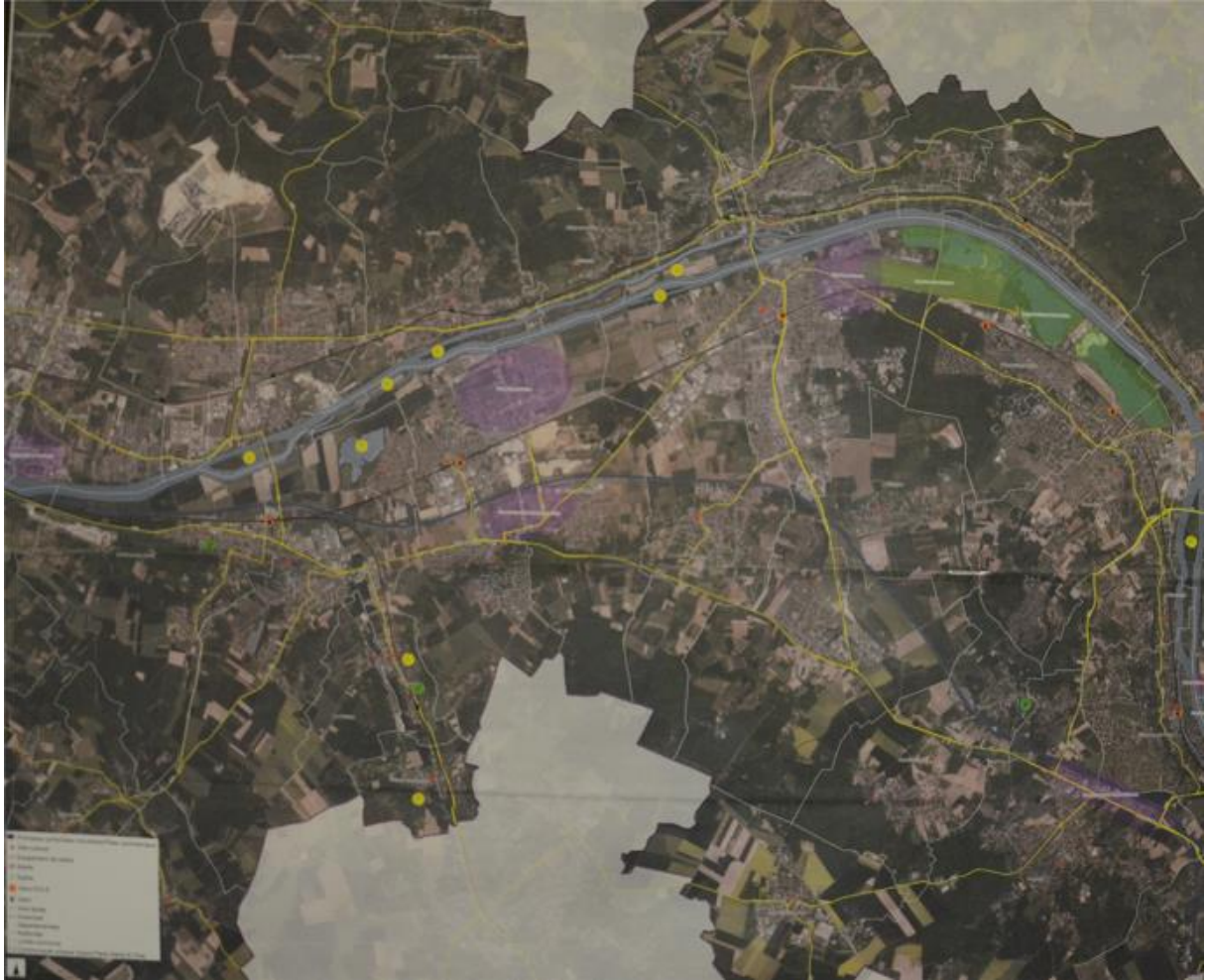
Contributions des tables 1 à 3 sur la carte de la thématique paysage : les gommettes vertes représentent les espaces publics remarquables, les gommettes jaunes les paysages remarquables