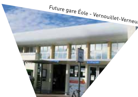
Future gare Éole - Vernouillet-Verneuil

02 | Valoriser la Seine de Mousseaux-sur-Seine à Conflans-Sainte-Honorine sur les plans paysagers, économiques, touristiques et de loisirs.